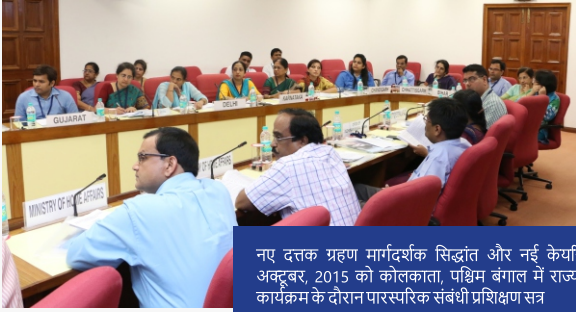
नए दत्तक ग्रहण मार्गदर्शक सिद्धांत और नई केयरिंग्स पर ५-६ अक्टूबर, 2015 को कोलकाता, पश्चिम बंगाल में राज्य अभिविन्यास कार्यक्रम के दौरान पारस्परिक संबंधी प्रशिक्षण सत्र